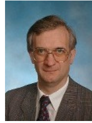
Autor: Dr. Wolfgang Feist

chaleur sont très faibles. Cela implique que l'isolation de l'enveloppe doit être très bonne - surtout dans les régions au climat froid. Quel doit être le degré d'isolation ? Cela doit être calculé au préalable en effectuant un bilan énergétique.